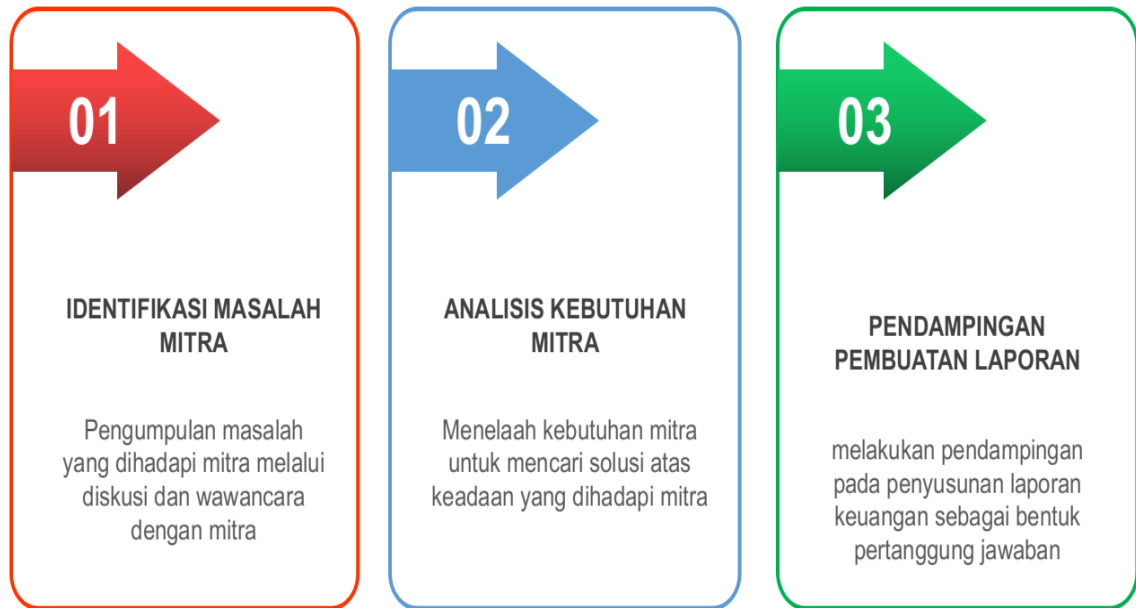
Gambar 1. Rancangan kegiatan pengabdian

Rancangan diatas menggambarkan evaluasi yang dapat diuraikan dalam beberapa materi yang akan diserahkan ke CV XXX sebagai bentuk pelaksanaan pengabdian yakni sebagai berikut: