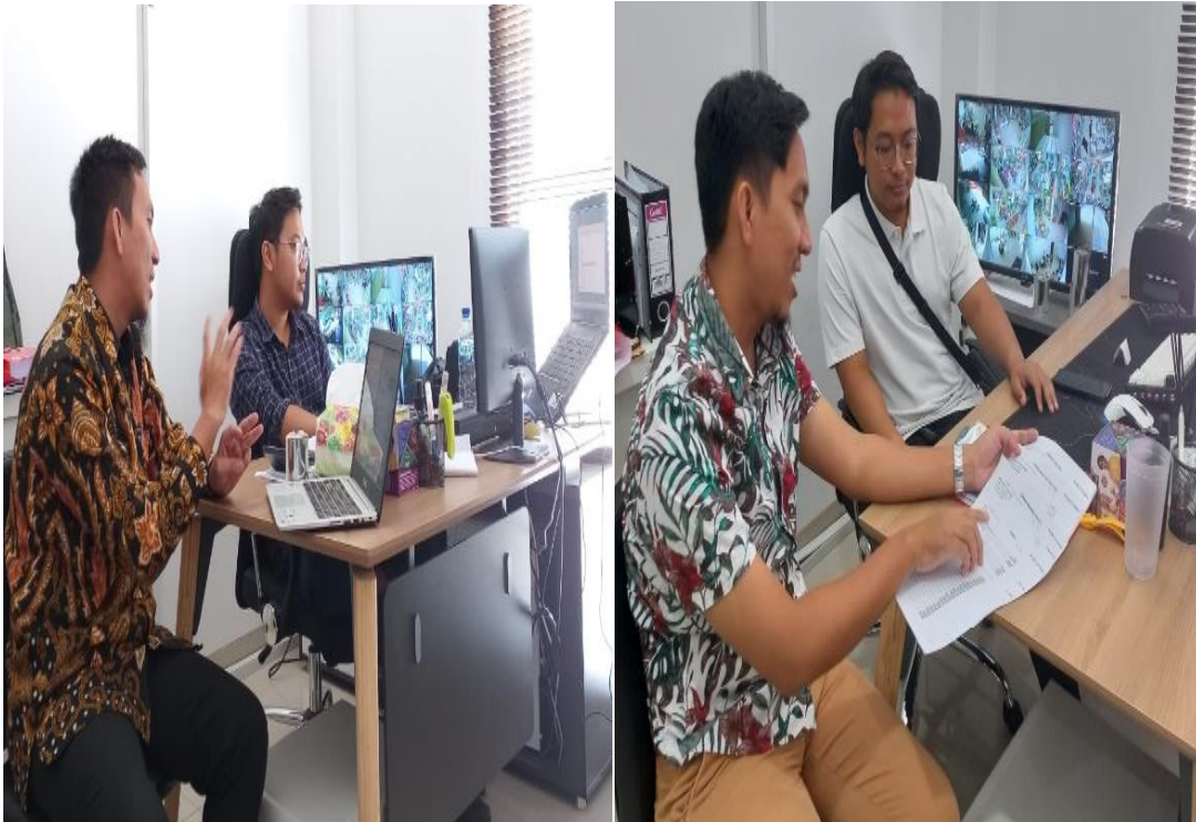
Gambar 2. Penyampaian materi dan pendampingan oleh pengabdian

Pendampingan dan penyusunan LK CV XXX dilaksanakan pada tanggal 8 Mei 2023. Setelah masalah dan potensi sudah ditemukan. Pendampingan dilakukan oleh pengabdian dengan memberikan model LK CV yang benar dan memberikan arahan tentang pentingnya LK yang sesuai dengan standar akuntansi yang berlaku umum kepada manajer sekaligus akunting CV XXX.